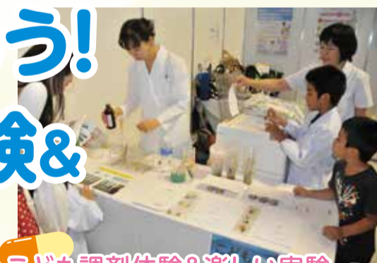
こども調剤体験&楽しい実験